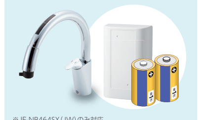
※JF-NB464SX (JW) のみ対応

浄水栓でつくの水はペットボトル水に比べコストパフォーマンスが優れています。その上、重いペットボトルの持ち運びもなく、空になったペットボトルの後始末もありません。