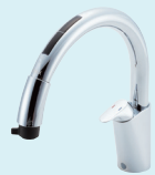
ナビッシュ Bタイプ JF-NB466SXU (JW) ¥128,000 (税抜) ※一般地用のみ