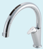
ナビッシュ Aタイプ JF-NA466SU (JW) ¥144,000 (税抜) ※一般地用のみ