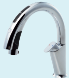
ナビッシュハンズフリー JF-NA411S (JW) JF-NA411SN (JW) ¥159,000 (税抜)