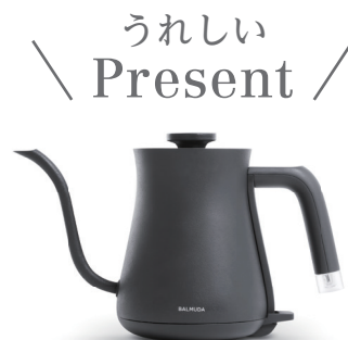
BALMUDA The Pot