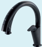
ナビッシュハンズフリー JF-NA411S/SAB (JW) JF-NA411SN/SAB (JW) ¥214,000 (税抜)